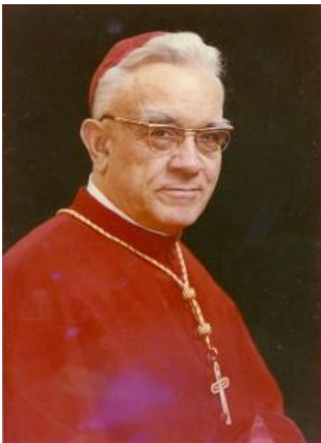
Lékai László bíboros

1. Az értéktárba felvételre javasolt nemzeti érték fényképei: