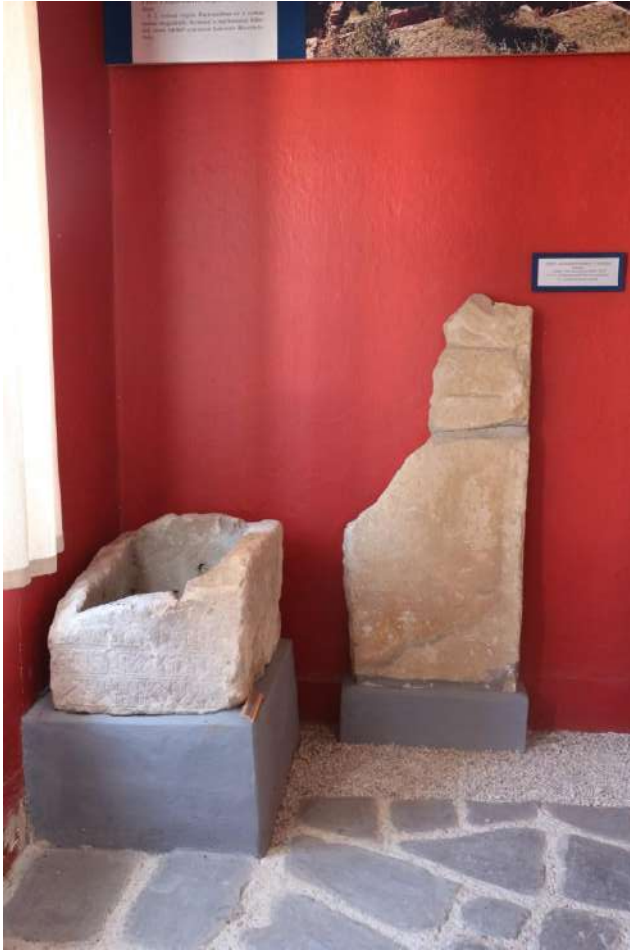
2. kép A táblán szereplő felirat: Sírkő, Zalaszentgyörgy II. század