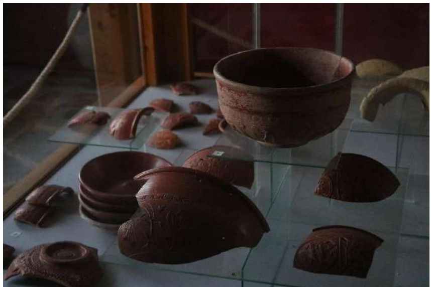
18. kép Megmunkált kerámia edények.