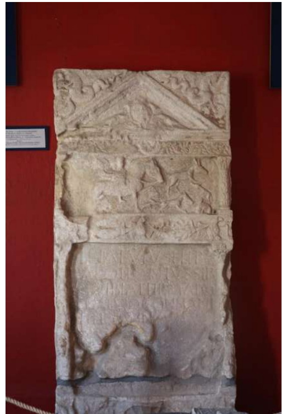
3. kép Táblán szereplő felirat: Baksáról, a Kerka folyó medréből előkerült sírkő I-II. század