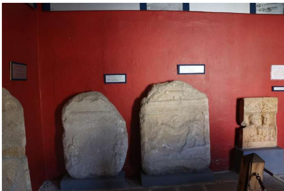
5. kép Különböző jeleneteket megjelenítő sírkövek.