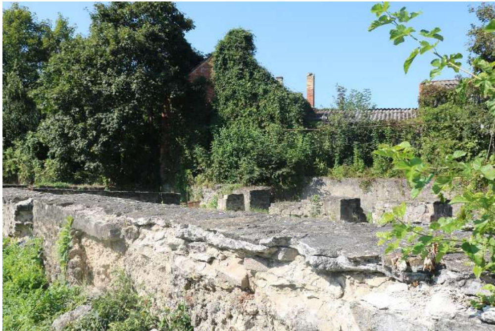
22. fénykép: Polgárház falai III.