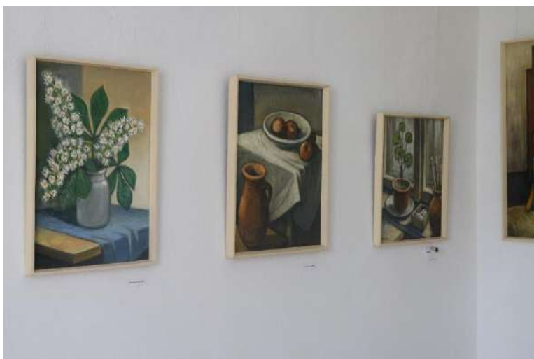
24. fénykép Varga József fényképei