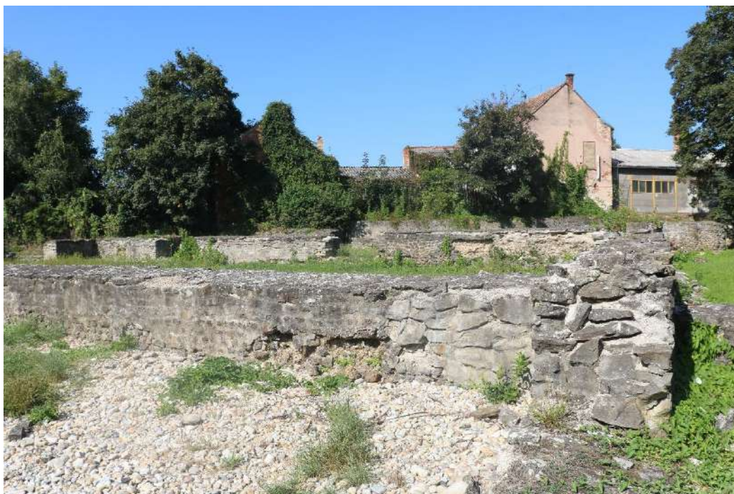
20. fénykép: Polgárház falai