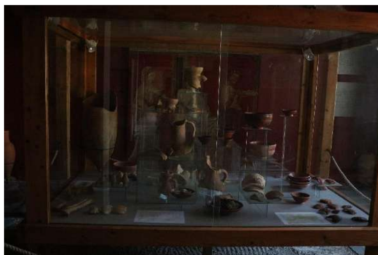
14. kép Amfora, edény és tál töredékek.