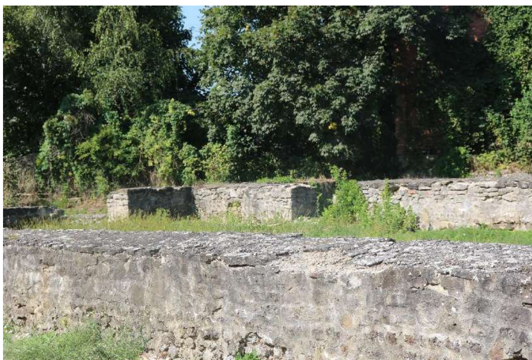
21. fénykép Polgárház falai II.