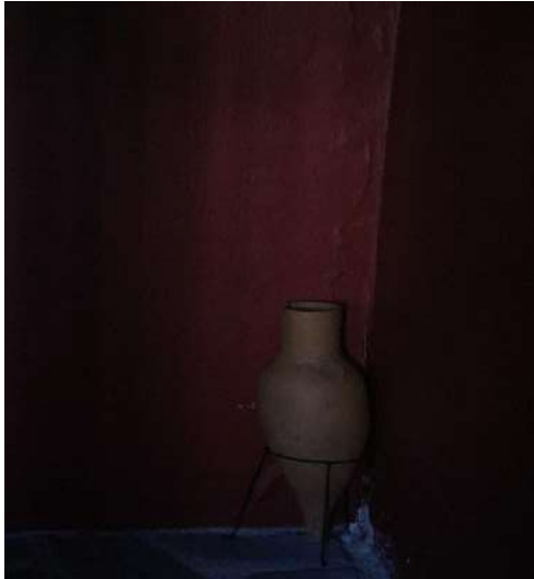
17. kép Amfora a sarokban.