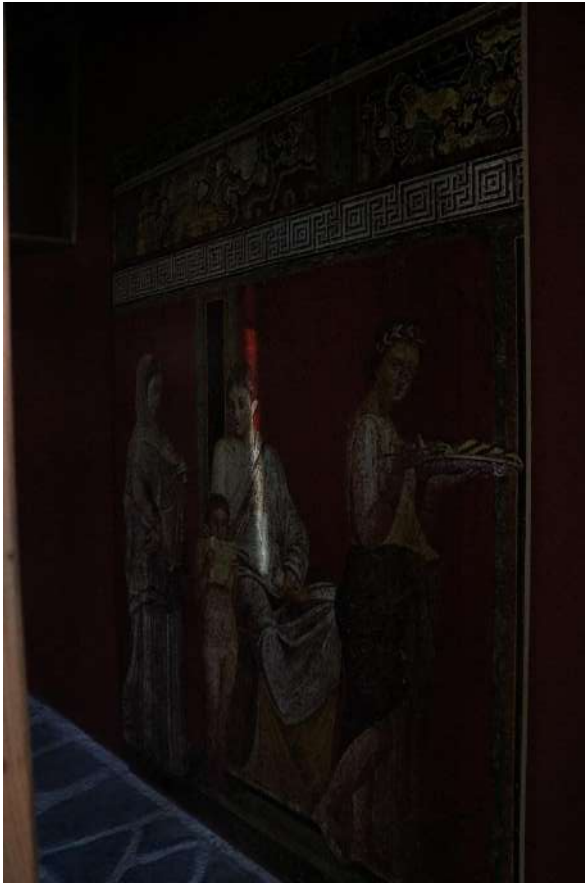
15. kép Római kori hétköznapi jelenet.