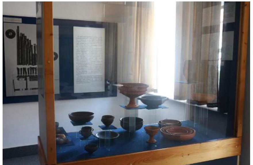
13. kép Edények, pohárkák, tálak.