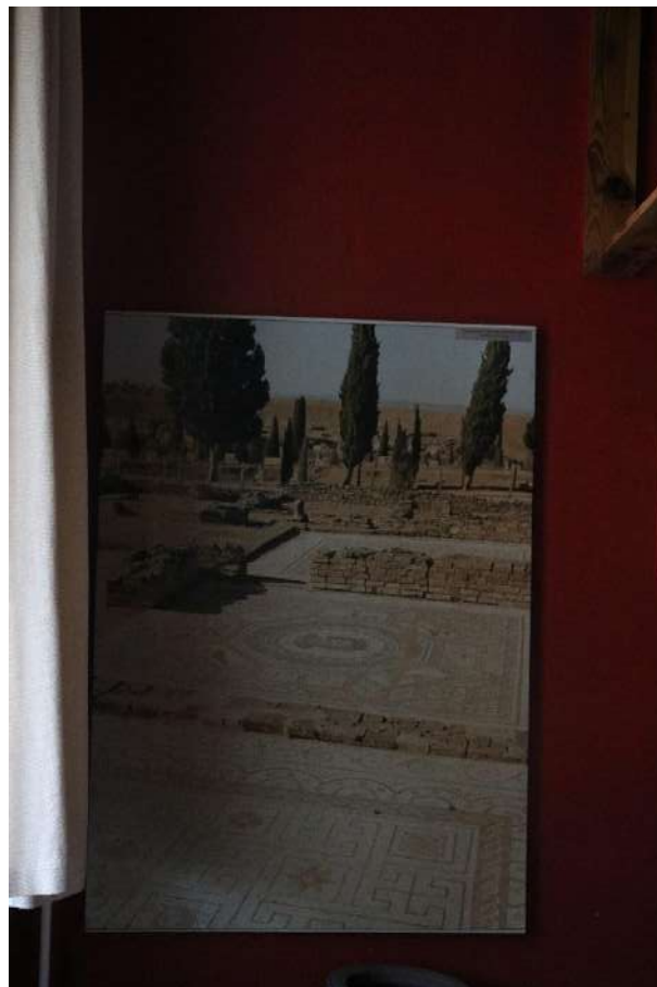
16. kép Római pompás építkezési stílus képe.