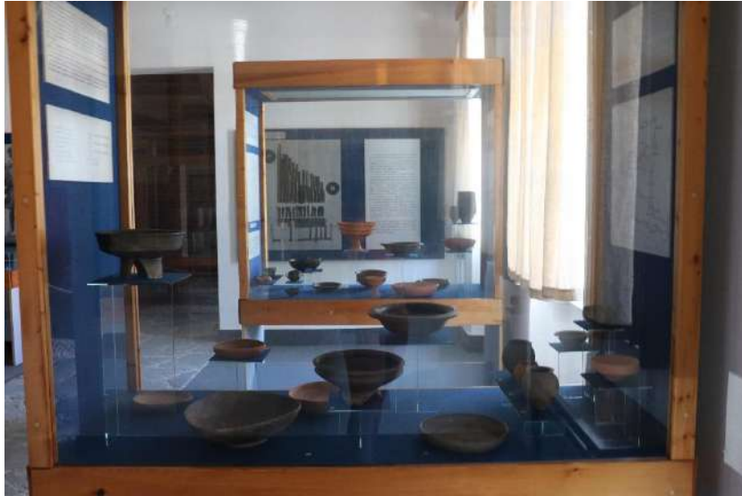
12. kép Edények, tányérok.