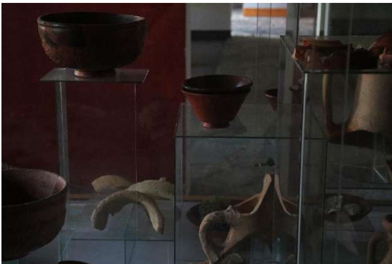
19. kép Edények.