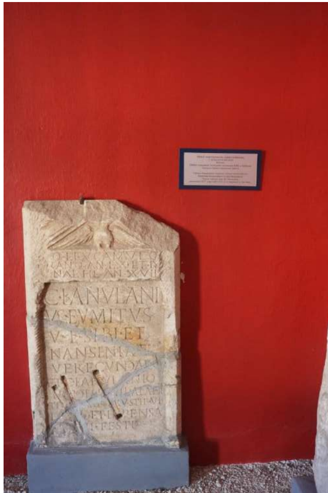
4. kép Táblán szereplő felirat: Sírkő, Inkey-kápolna, Nagykanizsa, II. század első fele